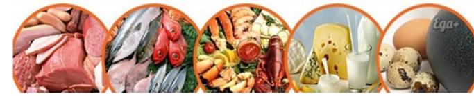
Мясо Рыба Море - продукты Молочные продукты Яйцо